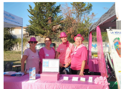
Le collectif "réflexologie Gard" partenaire de la course la Zontienne