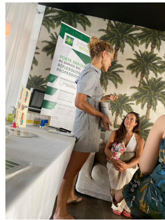
Les adhérents de l'île de la Réunion ont fait découvrir la réflexologie.