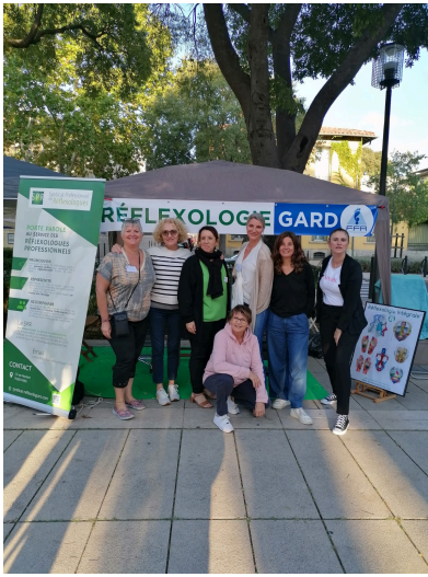
Le collectif "réflexologie Gard" à Nîmes.